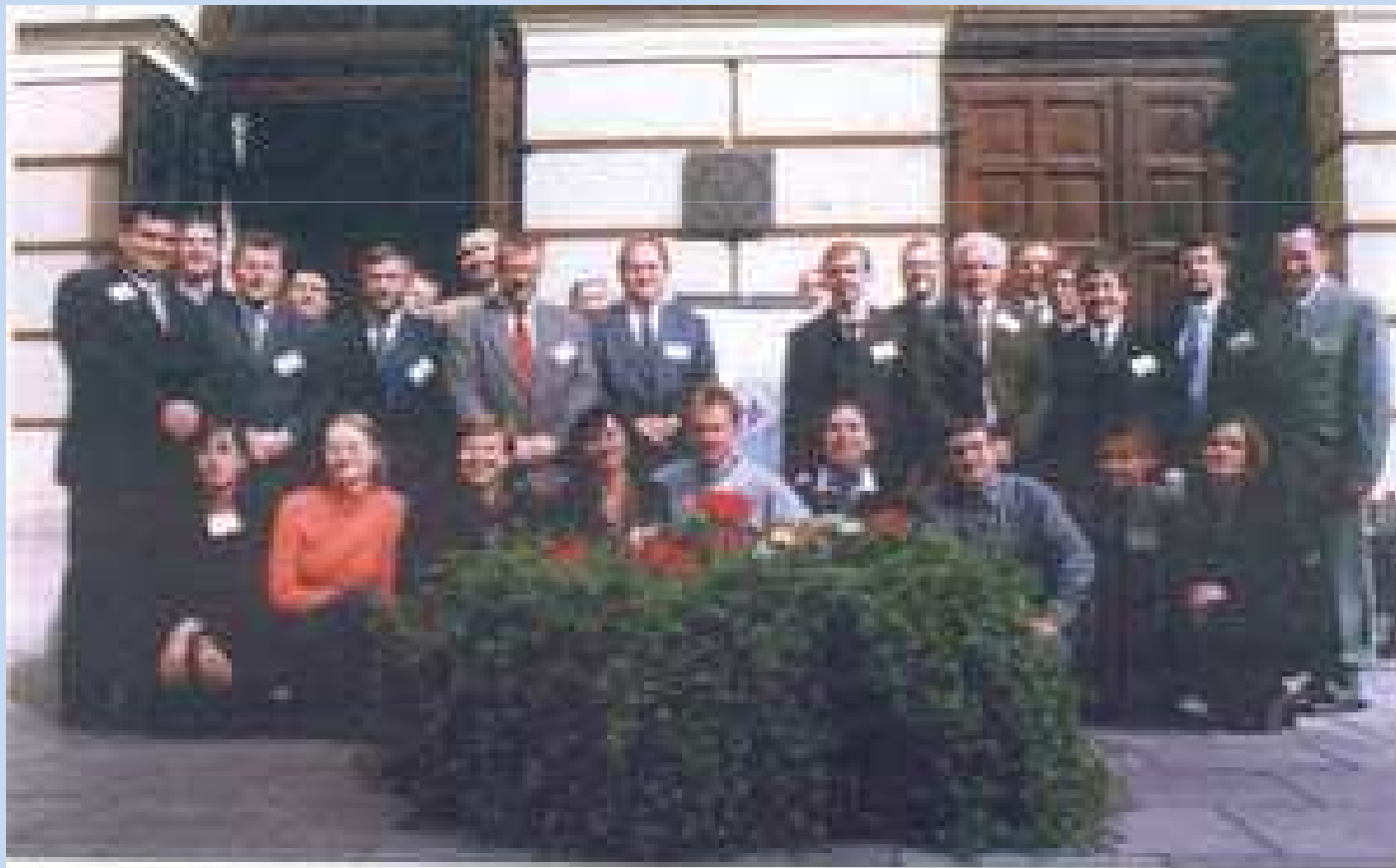
Uczestnicy Konferencji NATO

Studium NATO-Edukacja Ekologiczna w Siłach Zbrojnych Committee on the Challenges of Modern Society